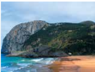
LAGA HONDARTZA PLAYA DE LAGA Ibarrangelu 26km - 34 min.